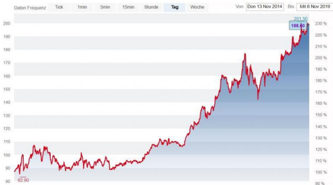
Der Kurs der HBM-Healthcare-Aktie in den vergangenen fünf Jahren.

Dies dürfte mit dem allgemein freundlichen Marktumfeld, aber auch mit unserer seit Jahren guten Finanzperformance und der Investitionsstrategie zusammenhängen. Wir konnten über die letzten zehn Jahre den inneren Wert (NAV) um jährlich 13,2 Prozent steigern. Die Aktie nahm aufgrund der Diskontverkürzung um sogar 17,2 Prozent pro Jahr zu.