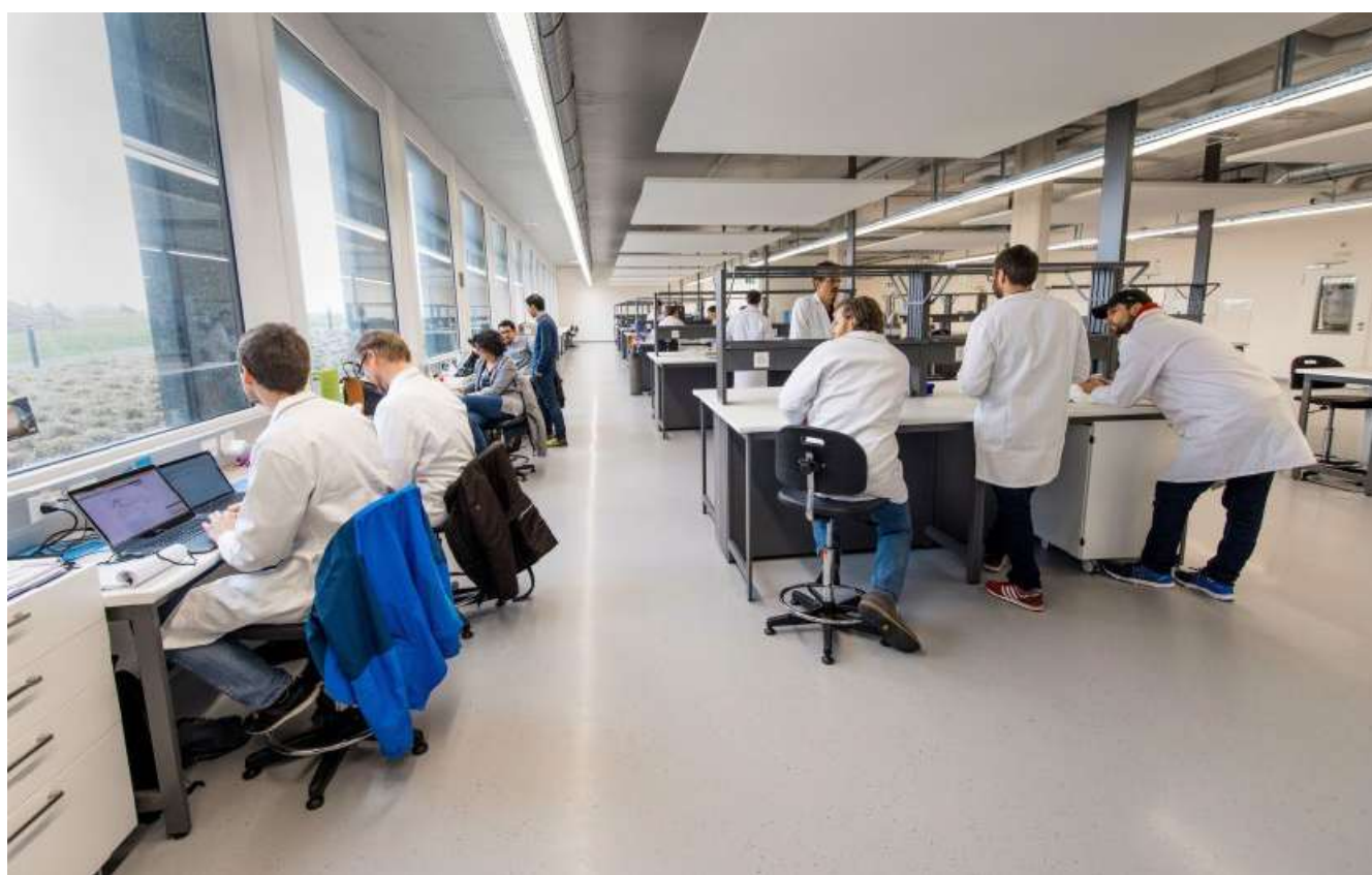
Im 700 Quadratmeter grossen Labor des Inkubators StarLab@Biopôle in Lausanne können bis zu zwölf Jungunternehmen forschen.